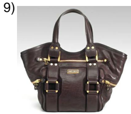
the bag, purse

Words to Match: la televisión - el escritorio - la recámara - la silla - el descanso - el despertador - los muebles - la bolsa - la estantería - el teléfono - el bote de basura - el sillón