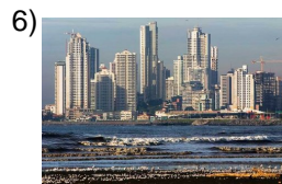
bigger and bigger