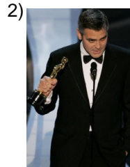
better and better