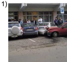
once and for all

Words to Match: cada vez mayor - tal cual vez - cada vez mejor - a veces - de una vez - alguna vez - a la vez - tal vez - cada vez peor - en vez de