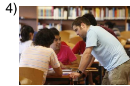
from bad to worse