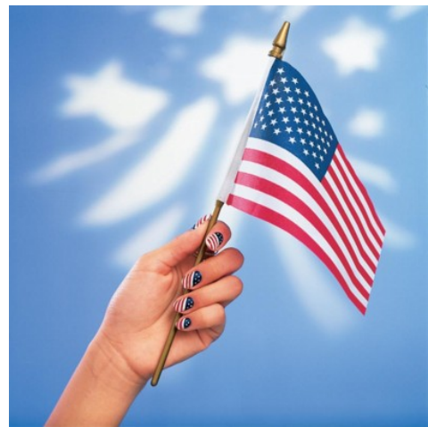
Fourth of July